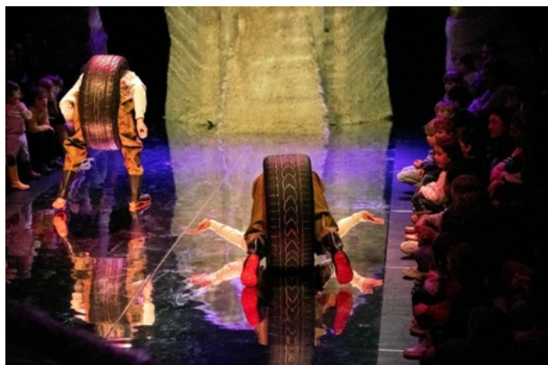
Gordeldieren, in de fantasie van de acteurs van Meneer Monster.

Een sexy, uitdagende cheetah dartelt bevallig op torenhoge plateaupumps in een gevlekte ochtendjas over het podium. Ze stoeit met de steenbok op flyjumpstelten die speels wegspringt. Uit een hoopje rotsen piept later een kop met een lange snuit: hij zuigt een voor een kerstlampjes op, in dit geval mieren die er in het donker vandoor proberen te gaan voor de miereneter.